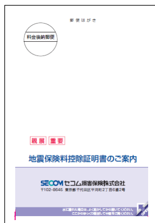
(満期戻総合保険用)